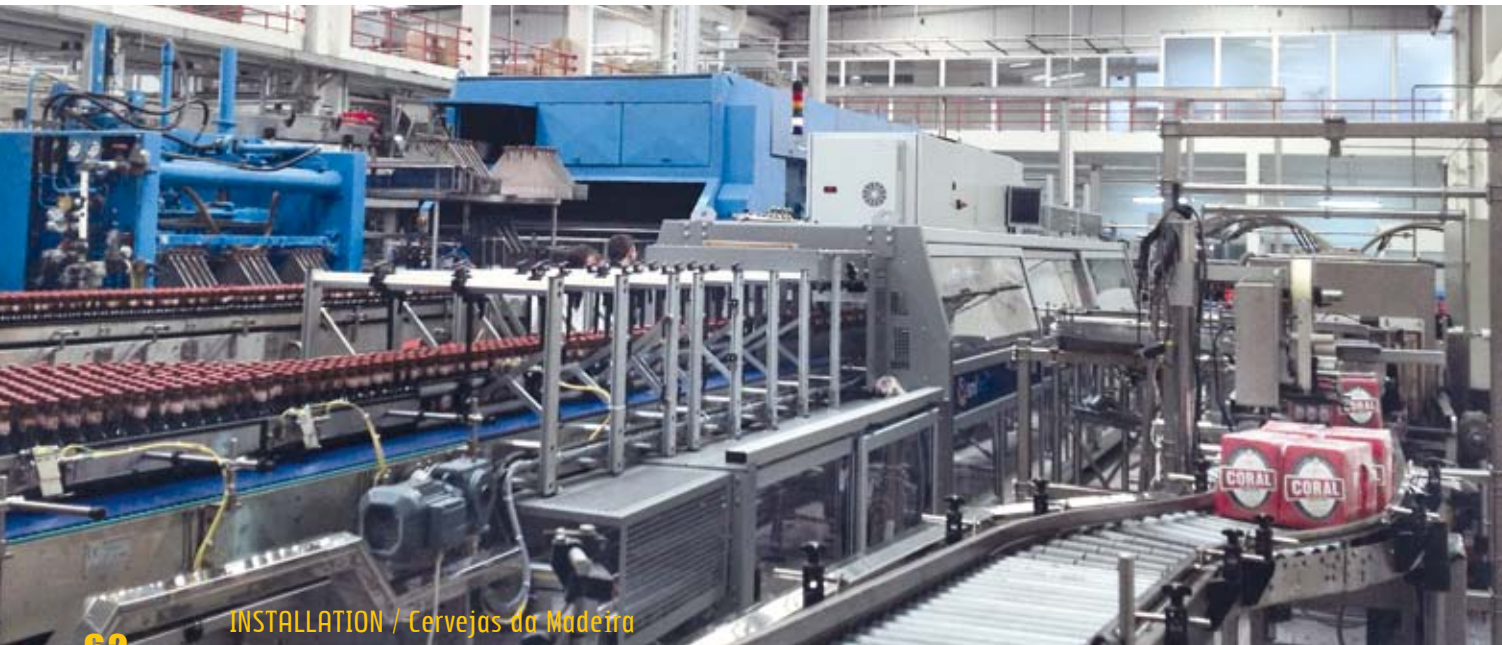
INSTALLATION / Cervejas da Madeira