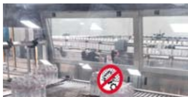
INSTALLATION / El Bahouara